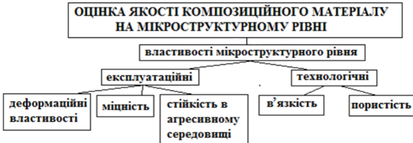
Рис. 1. Показники якості композиційних матеріалів.

Якістю матеріалу при моделюванні та синтезі керують за допомогою варіювання рецептурно-технологічних факторів, вибір яких залежить від знань про матеріал і технологію, фактичні можливості управління виробництвом. В роботі [1] наводяться ієрархічні структури мікро-, мезо- та макrorівнів структури КМ. При «переході» на наступний структурний рівень (до нового матеріалу) оптимізовані рецептури та технологія попереднього рівня удосконалюються. Тому послідовне поєднання рівнів (від мікро- до макроструктури) вимагає виділення критеріїв (властивостей), які забезпечують отримання якісного композиційного матеріалу лише на рівні макроструктури (продукту технології). Основні критерії якості КМ на мікрорівні представлені на рис. 1.